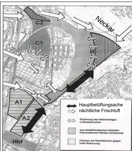
Luftströme im Stuttgarter Talkessel

Bei einem Brand im Lausterareal würden die Rauchschwaden ebenso auf den Talkessel gerichtet sein wie hier die Abgasfahne.