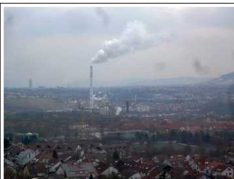
1. März 2018 12 Uhr. Stuttgart: Blick über das Gebiet Hallschlag auf das Lausterareal und das Müllheizkraftwerk Münster bei Nordost- Wetterlage. Entfernung Lausterareal- Hauptbahnhof: 5 km

Kritik: Die Anlagen liegen im nördlichen Trichter des Talkessels. Luftschadstoffe aus Bränden (Dioxine) und aus dem LKW-Verkehr werden bei Nordost-Wetterlagen konzentriert in den Talkessel gedrückt. Bei Zweifeln darüber, ob eine UVP rechtlich erforderlich ist oder nicht, sollten sich die Vertreter öffentlicher Belange dafür entscheiden.