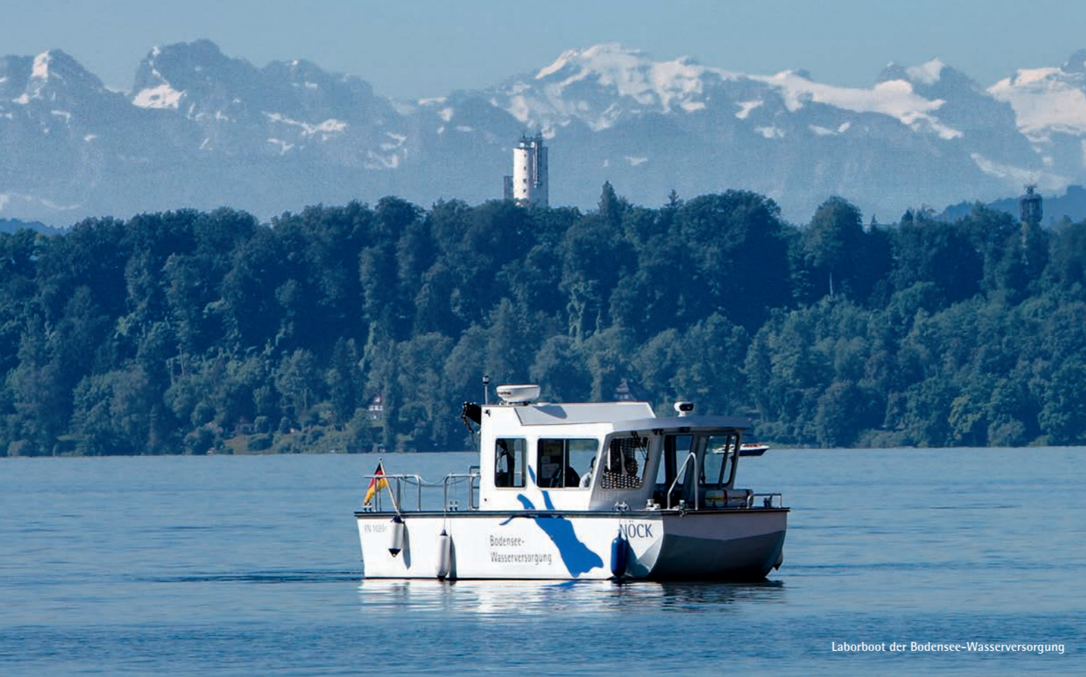
Laborboot der Bodensee-Wasserversorgung